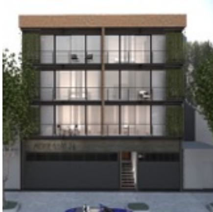
MONTE ALBÁN 74