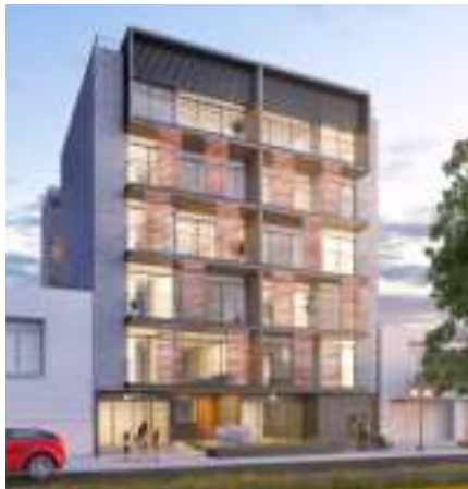
DR. VÉRTIZ 530